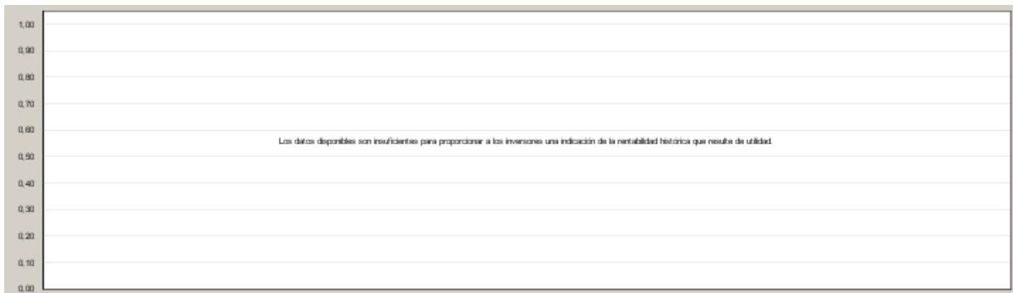
Gráfico rentabilidad histórica

Datos actualizados según el último informe anual disponible.