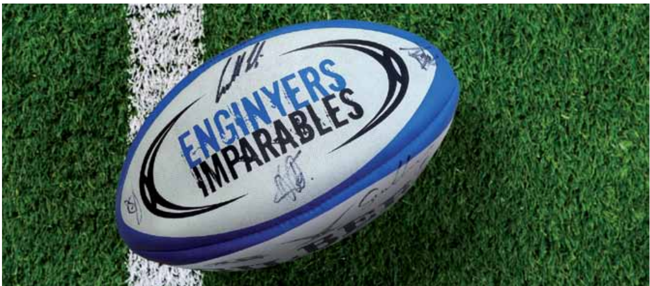
ENGINYERS RUGBY UNION CLUB

Colaboración en la realización de eventos y jornadas, tales como la Día del Ingeniero, el Ciclo de Música y Coral y la Carrera Intercolegial.