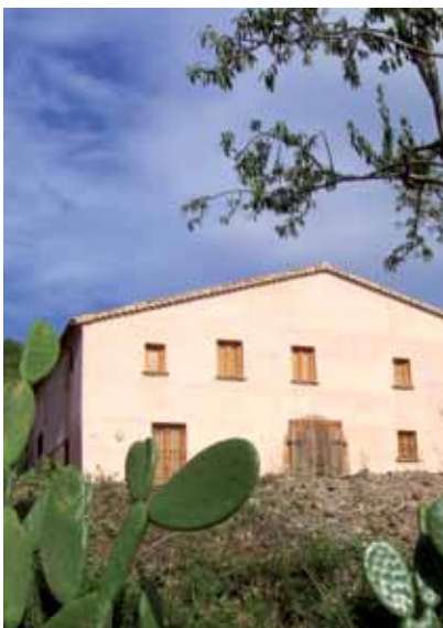
MASÍA CAN PALÓS

Minyons Escoltes. Ayuda a la restauración y adecuación de la masía Can Palós (Sant Boi de Llobregat) como espacio educativo (Aula Natura). Se han aplicado sistemas de geotermia para calentar agua sanitaria y calefacción y se ha construido una depuradora biológica con el consecuente ahorro energético y de consumo de agua.