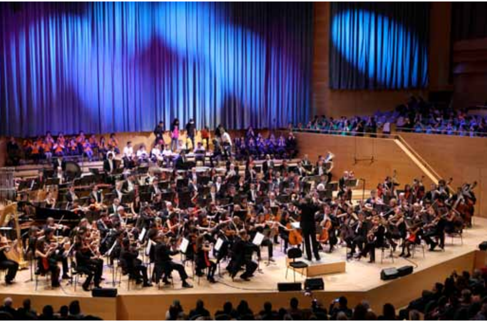
ET TOCA A TU