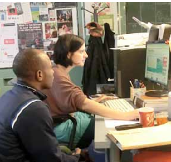
ASSOCIACIÓ PUNT DE REFERÈNCIA

Arrels Fundació. Colaboración con esta fundación en el proyecto de atención a personas sin hogar en la ciudad de Barcelona.