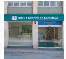
Nova oficina a Manresa