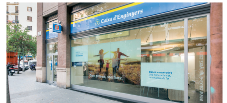
Nova oficina a Barcelona.

En aquest mateix procés d'apropament al soci, hem obert una nova oficina al barri de l'Eixample de Barcelona, ubicada al carrer Comte Borrell, 202. Amb aquesta obertura, sumem un total de 10 oficines al servei dels socis a la ciutat comtal.