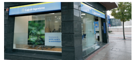
Nova oficina a Bilbao.

L'oficina central de Bilbao, fins ara situada a les instal·lacions del Colegio Oficial de Ingenieros Industriales de Bizcaia, s'ha traslladat al carrer Alameda Rekalde, 2. La nova oficina té un espai més ampli per a l'atenció personalitzada amb l'objectiu d'oferir al soci un servei de millor qualitat.