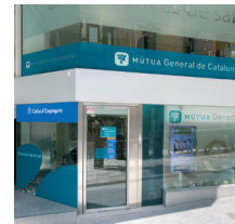
Nova oficina a Vic

Gràcies a l'acord estratègic amb Mútua General de Catalunya, hem inaugurat a Vic (Rambla de l'Hospital, 6) i Manresa (Passeig Pere III, 66) dues oficines 'AVANT'. Aquestes dues obertures donen resposta al creixement de la demanda de servei, però també a la voluntat de prestar un tracte personalitzat i de valor potenciant la multicanalitat gràcies a l'alta digitalització operacional bancària.