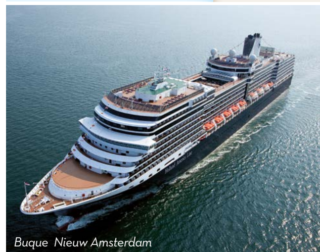
Buque Nieuw Amsterdam