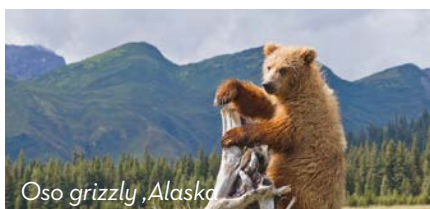
Oso grizzly, Alaska