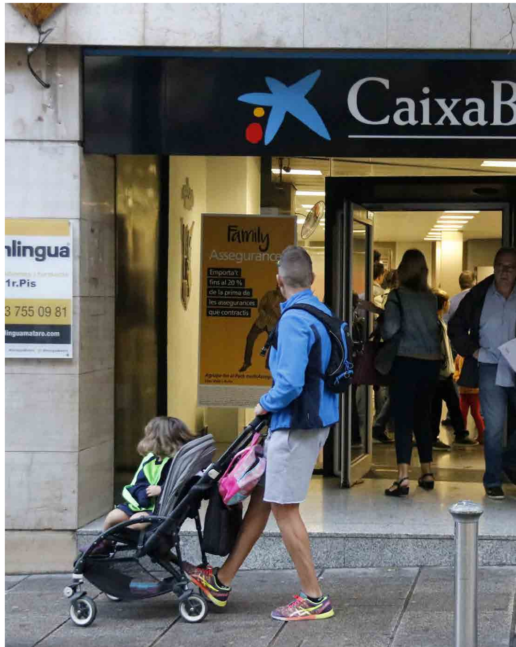
Clients fent cua en una oficina de Caixabank, abans de la pandèmia.