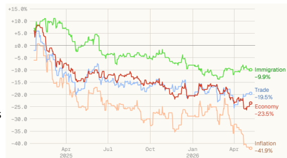
Gráfico 1. Impopularidad de Donald Trump (% a favor - % en contra en diversos aspectos: inmigración, comercio internacional, economía e inflación)

Estados Unidos llegaba a la cumbre con la urgencia estratégica del conflicto en Irán y con una baja popularidad interna de Trump. El cierre selectivo del estrecho de Ormuz por parte del país persa ha impulsado al alza el precio del petróleo y las tasas de inflación a escala global, también en Estados Unidos. Ello se ha traducido en un nuevo revés en los sondeos, que reflejan unos niveles de popularidad muy reducidos, incluso en aspectos en los que Trump y el Partido Republicano habían mostrado una ventaja relativa frente al Partido Demócrata, como la gestión económica o la lucha contra la inflación.