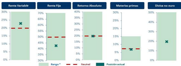
Caja Ingenieros Gestión Alternativa