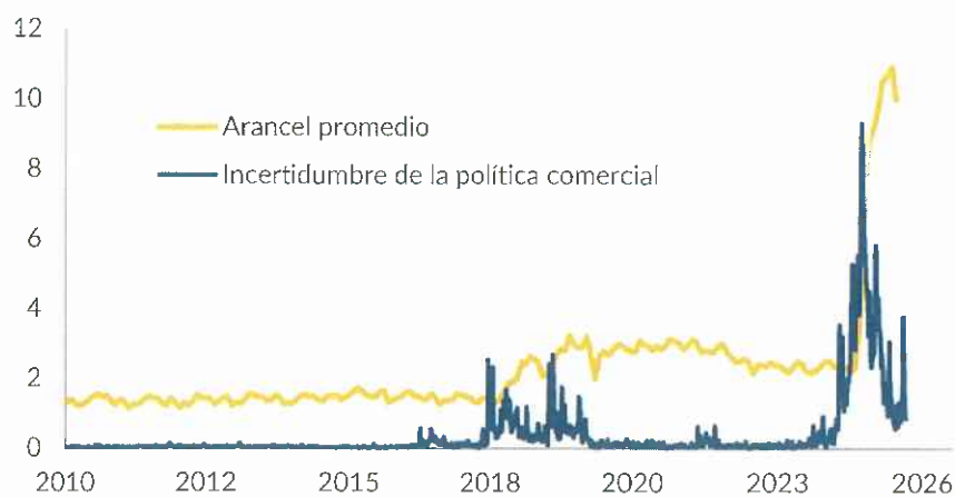
Gráfico 1. Arancel promedio de las importaciones de Estados Unidos e incertidumbre asociada a la política comercial del país

El año 2025 ha estado marcado por la incertidumbre generada por las políticas de la administración Trump en Estados Unidos. El anuncio, el día 2 de abril, de la nueva política de aranceles que Donald Trump bautizó como Liberation Day suponía elevar el arancel promedio de Estados Unidos a los niveles más altos del último siglo. No obstante, ajustes posteriores en los mismos y acuerdos alcanzados con un número significativo de países permitieron moderar su alcance. En medio de todo el vaivén, China, a pesar de haber sido el foco de la retórica de Trump, logró cerrar un acuerdo comercial relativamente favorable, gracias a su dominio en la producción y el refinado de las conocidas como tierras raras, fundamentales para sectores de muy alta tecnología, y a la amenaza de restringir su exportación. Cabe destacar que las amenazas arancelarias de Trump fueron perdiendo credibilidad y efectividad, lo que se tradujo en impactos cada vez menores en los mercados financieros a medida que avanzaba el año.