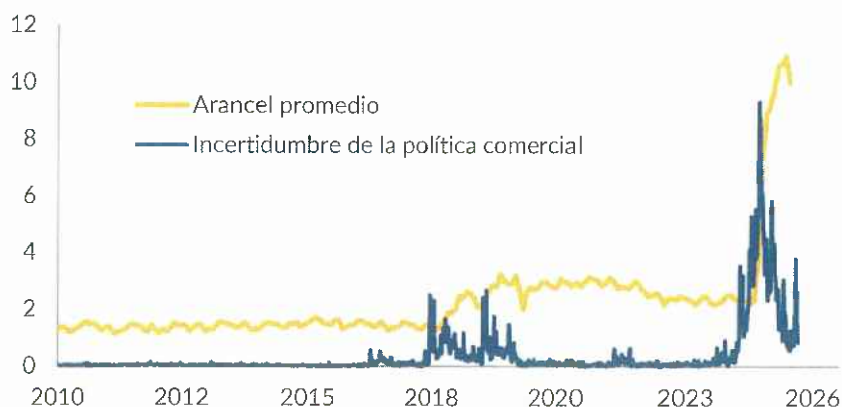
Gráfico 1. Arancel promedio de las importaciones de Estados Unidos e incertidumbre asociada a la política comercial del país

El año 2025 ha estado marcado por la incertidumbre generada por las políticas de la administración Trump en Estados Unidos. El anuncio, el día 2 de abril, de la nueva política de aranceles que Donald Trump bautizó como Liberation Day suponía elevar el arancel promedio de Estados Unidos a los niveles más altos del último siglo. No obstante, ajustes posteriores en los mismos y acuerdos alcanzados con un número significativo de países permitieron moderar su alcance. En medio de todo el vaivén, China, a pesar de haber sido el foco de la retórica de Trump, logró cerrar un acuerdo comercial relativamente favorable, gracias a su dominio en la producción y el refinado de las conocidas como tierras raras, fundamentales para sectores de muy alta tecnología, y a la amenaza de restringir su exportación. Cabe destacar que las amenazas arancelarias de Trump fueron perdiendo credibilidad y efectividad, lo que se tradujo en impactos cada vez menores en los mercados financieros a medida que avanzaba el año.